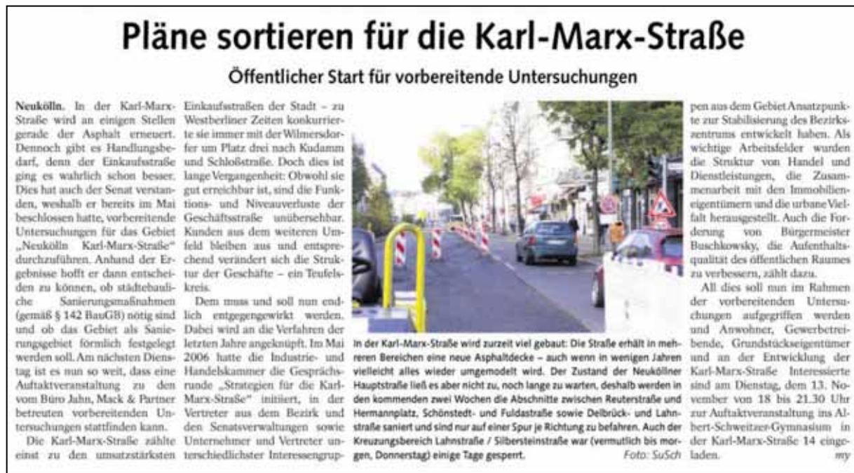
Artikel aus Berliner Abendblatt Neukölln vom 7.11.2007