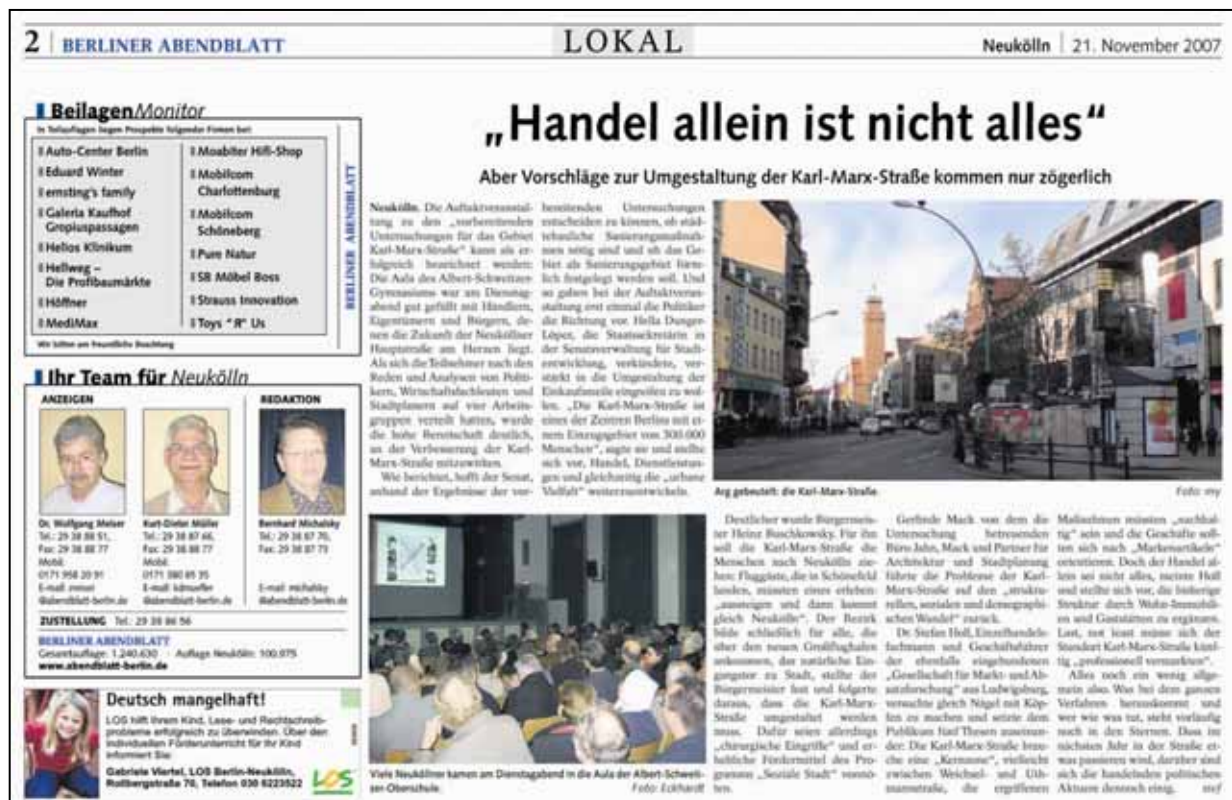
Artikel aus Berliner Abendblatt Neukölln vom 21.11.2007