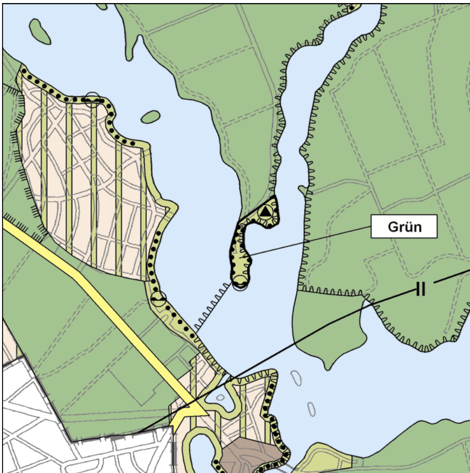
FNP-Änderung (wirksam mit Bekanntmachung im Amtsblatt) 1:25.000