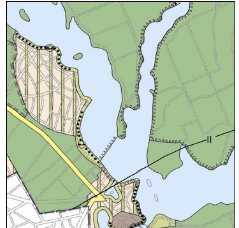
FNP Berlin (Stand April 2005) 1:50.000