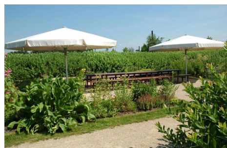
Beitrag 509 | von BUND Berlin e.V. | 11.11.2005