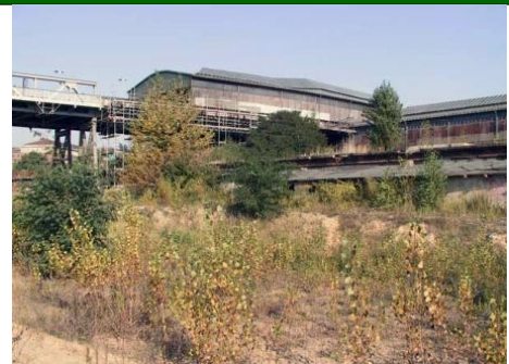
Blick auf den U-Bhf. Gleisdreieck