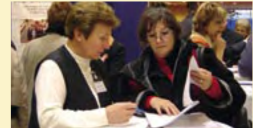
Bürgernahe Politik: Der Petitionsausschuss des Abgeordnetenhauses nimmt in einem Einkaufszentrum Anliegen und Beschwerden auf.

Ogleich der Obrigkeitsstaat in den vergangenen Jahrzehnten überwunden wurde, haben viele Bürger immer noch das Gefühl, dass die Verwaltung über „ihre Köpfe hinweg“ entscheidet und sich nicht an ihren Interessen orientiert.