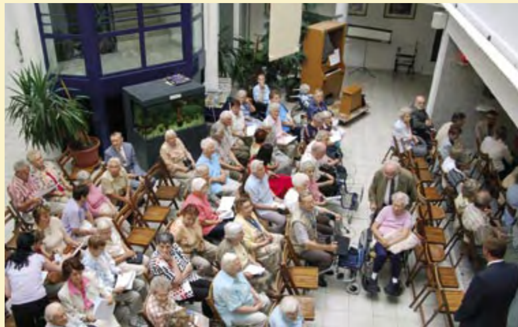
Mehrfachnutzung von Gebäuden: Im Altersheim der Caritas Altenhilfe GGmbH Berlin wird öffentlich ein Film gezeigt.