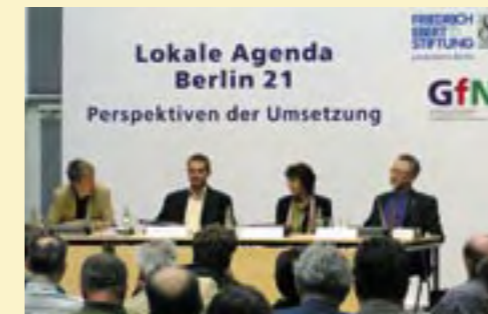
Beratung über die künftige Arbeit der verschiedenen Agendaakteure auf einer Veranstaltung der Friedrich-Ebert-Stiftung und der Gesellschaft für Nachhaltigkeit.