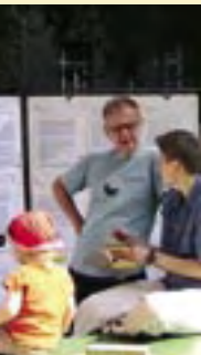
Im Kiezbüro wird Freiwilligenarbeit koordiniert.

Gerade auch die jungen Menschen in der Stadt übernehmen frühzeitig Verantwortung für sich selbst, für andere und für die Gesellschaft. Berlin schafft positive Lebensbedingungen für junge Menschen: In einem lebendigen Sozialraum wirken Kinder und Jugendliche aktiv an der Gestaltung ihres Lebensumfeldes mit.