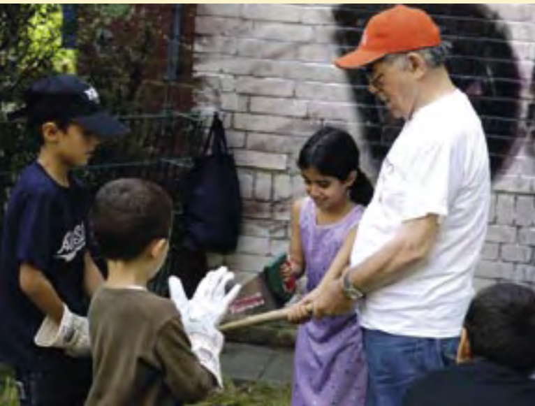
Ehrenamtliche Arbeit für ein schönes, lebensfrohes Stadtbild.

Die Diskussion über die gesellschaftliche Entwicklung ist davon geprägt, dass die Bürgergesellschaft ein höheres Maß an Eigenverantwortung und Mitgestaltung fordert, andererseits aber das längerfristige Engagement in Parteien und Verbänden immer mehr abnimmt. Demgegenüber wächst die Bereitschaft zum gesellschaftlichen Engagement, zur intensiven Mitwirkung und auch Mitbestimmung – gerade auch junger Menschen – in anderen traditionellen und neuen ehrenamtlichen Tätigkeitsfeldern in bemerkenswerter Weise. Parallel dazu werden Rufe nach dem Staat laut, um die