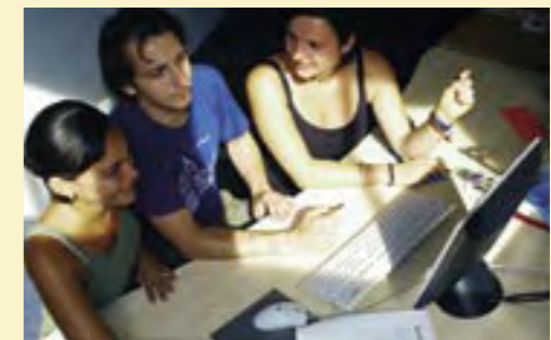
In Stadtteilkommissionen und Bürgerforen sollen auch junge Leute frühzeitig in die Entscheidungen zur Entwicklung ihres Lebensumfeldes einbezogen werden.