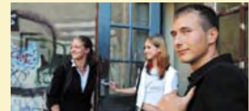
Schulen und andere öffentliche Gebäude sollen sich mehr als bisher für engagierte Bürger öffnen.

sich aktiv an demokratischen Prozessen zu beteiligen. Weiterhin ist prioritär, den Bürgern die Möglichkeiten von Engagement und Beteiligung durch umfassende Information näher zu bringen und sie durch geeignete Maßnahmen zu aktivieren. Hierzu bietet sich in Berlin erhebliches Potenzial.